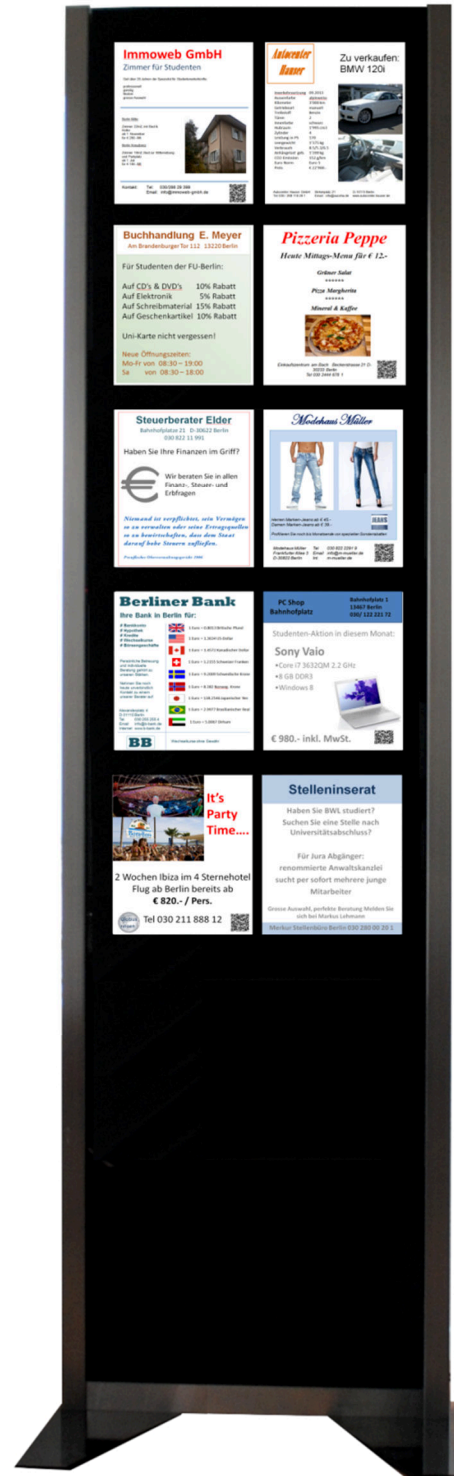
Beispiel: Diplayo mit 10 verschiedenen Kunden

Die Programmierung der Bildschirm-inhalte können Sie jederzeit problemlos selber vornehmen. Falls gewünscht, kann diese Arbeit aber auch durch das Diplayo Team vorgenommen werden.